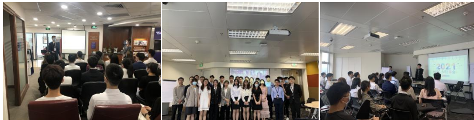
*汇丰银行实地参访