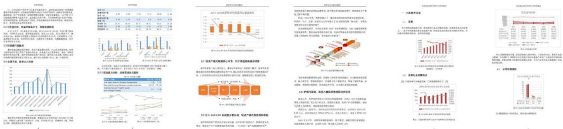
*20 级同学在大一期间独立完成的《行业研究报告》（已做模糊处理）